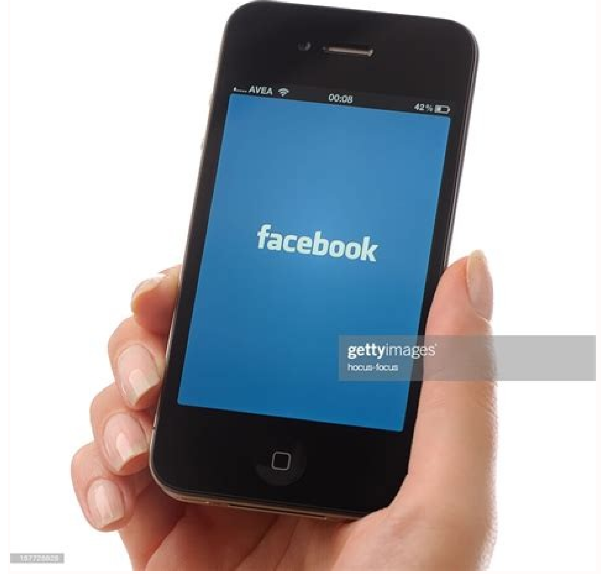
Facebook lite for iphone 4s. Facebook lite for iphone 4s free download.